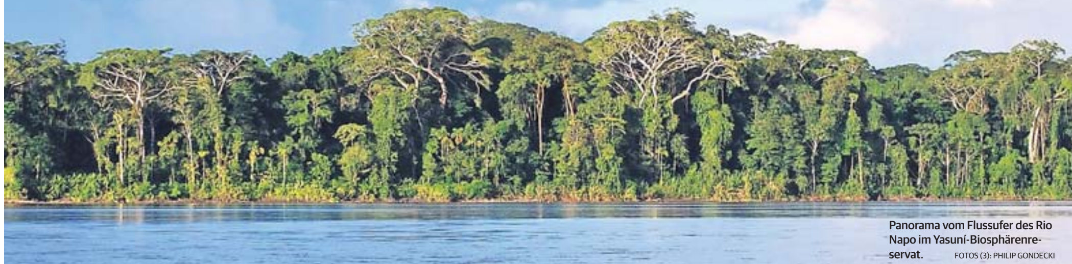
Panorama vom Flussufer des Rio Napo im Yasuni-Biosphärenreservat.