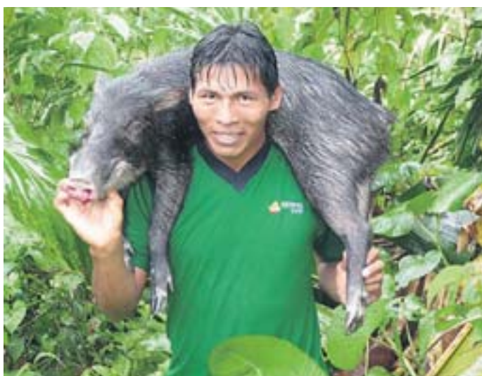
Ein Waorani-Mann mit erlegtem Pekari-Nabelschwein, das traditionell mit Holzspeeren gejagt wird.

Mitten im ecuadorianischen Amazonas-Dschungel wollen Waorani-Indianer ihrer traditionellen Lebensweise treu bleiben. Doch dort im Yasuni-Nationalpark gibt es auch Erdöl. Ein Konflikt mit Ansage.